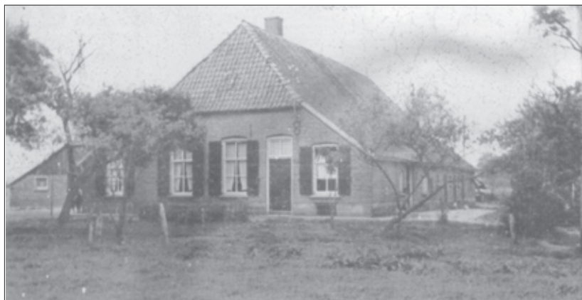
Klein Bleumink omstreeks 1914.

Klein Bleumink (huidig adres: Kapelweg 8, Wildenborch) was een van oudsher tot de Wildenborch behorende pachtboerderij, die bij de verkoop van het landgoed in 1924 na ruim 250 jaar overging in handen van de boer zelf. De naam Klein Bleumink doet vermoeden dat er ook een Groot Bleumink is geweest, en dit was inderdaad het geval. Helaas is niet bekend waar deze heeft gestaan. De naam Bleumink werd in de oudste bronnen weergegeven als Bloemink en waarschijnlijk uitgesproken als Bleumink (vgl. het Duitse oe en ö ), en in latere bronnen ook wel als Bluemink, Blümink (Rossel, 1996, p. 17) of Blumink. Het is geen unieke boerderijnaam, want in 1188 komt er al een erve Blominc voor in Geesteren (Slicher van Bath, 1944, p. 258). De naam zou afgeleid zijn van een Germaanse voornaam Bloma of Bluma dat volgens Hekket (1982, p. 36) verband houdt met blôme ‘bloem’. In Duitsland komen verschillende namen met het element blom- of blum- ‘bloem’ voor, o.a. in veldnamen, duidend op bloemrijk grasland en in de Westfaalse patronym Blöming (Bahlow, 1972, p. 65).