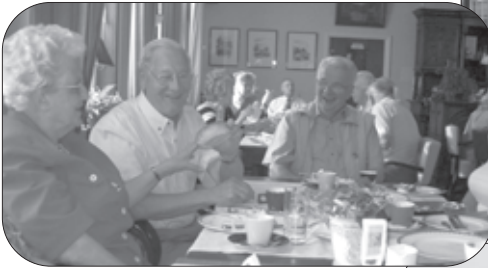
De bakkers keuren het brood