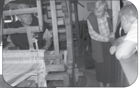
Weefgetouw bij De Wendezoele