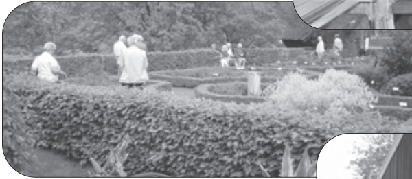
Kruidentuin bij de Wendezoele