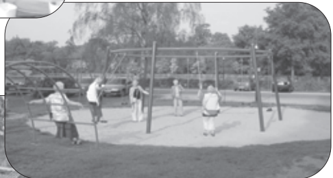
Schommelen in de speeltuin