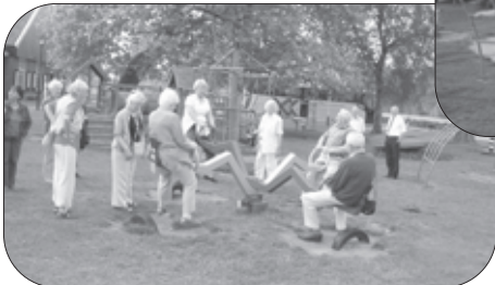
Op de 'tweedimensionale' wip