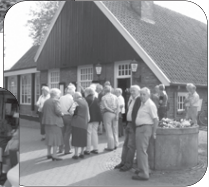
Restaurant 't Hoogspel