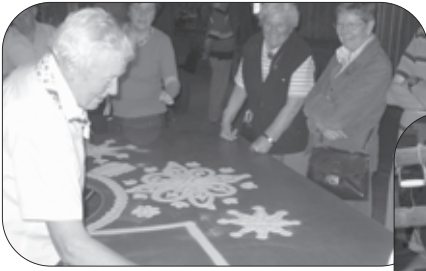
Figuren maken in strooizand