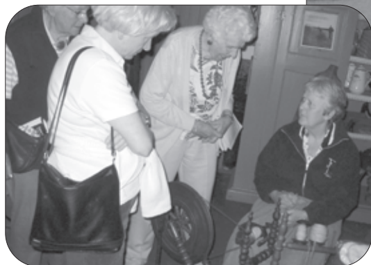
Wolspinster bij De Wendezoele