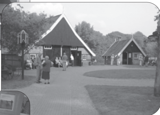
Ontvangstruimte en bakhuisje De Wendezoele